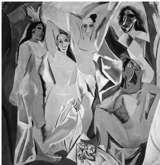
亚威农少女(毕加索作品)

中国很多研究者已经发现,韦努蒂的 Foreignization(“异化”,正确译名“洋化”)是现代派的继承,是解构主义在翻译理论领域的表现 [8] 。解构主义 60 年代缘起于法国,雅克·德里达——解构主义领袖——不满于西方几千年来贯穿至今的哲学思想,对那种传统的不容置疑的哲学信念发起挑战,解构主义打破秩序然后再创造更为合理的秩序。解构主义是对现代派原则加以继承,运用现代派的语汇,颠倒、重构,否定传统的基本设计原则,由此产生新的意义。用分解的观念,强调打碎,叠加,重组,重视个体、部件本身,反对总体统一,创造出支离破碎和不确定。